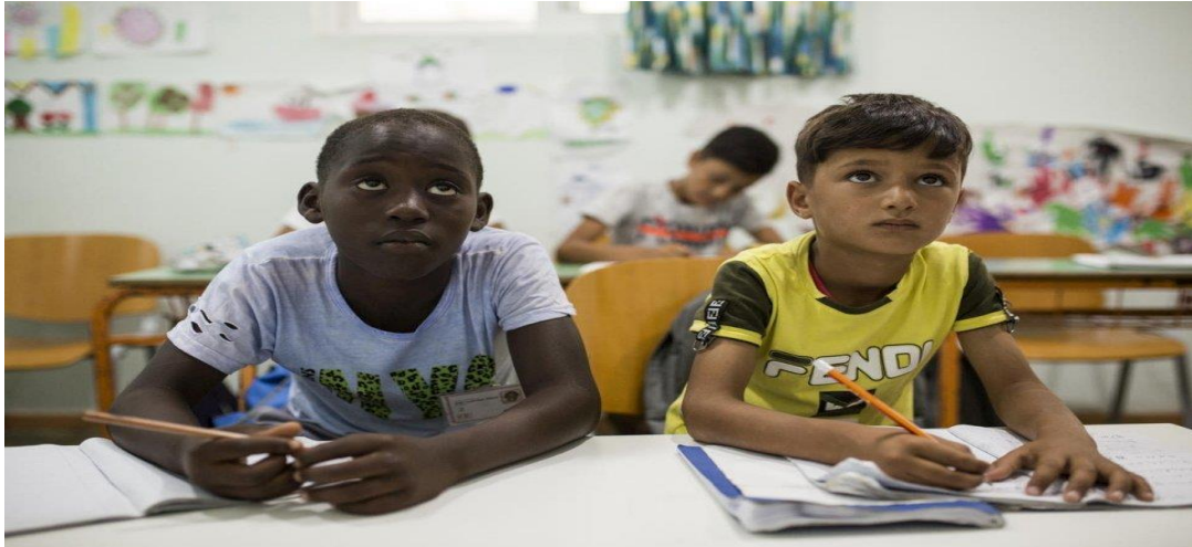
Παιδιά που μένουν στο Κ.Υ.Τ. στο Πυλί μαθαίνουν ελληνικά στο κέντρο μη-τυπικής εκπαίδευσης ΚΕΔΥ της Κω.

(Πηγή: Ελληνική Δημοκρατία, Υπουργείο Παιδείας, Έρευνας και Θρησκευμάτων, Επιστημονική Επιτροπή για τη στήριξη των παιδιών των προσφύγων (2017). Το έργο της εκπαίδευσης των προσφύγων, σελ. 57-60).